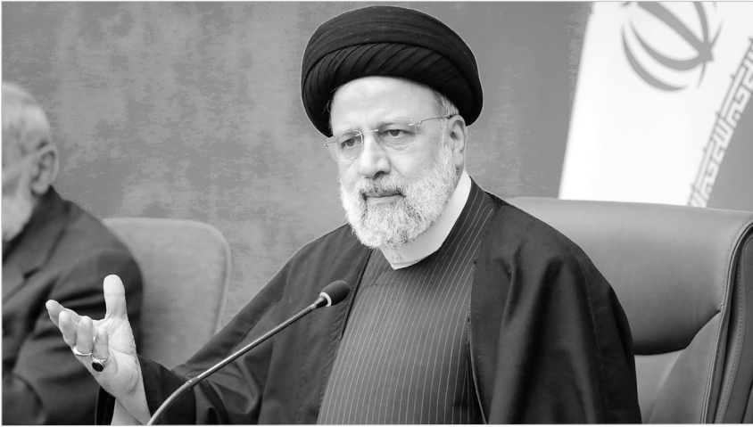
سید ابراهیم رئیسی، رئیس‌جمهور ایران در مراسم افتتاحیه مجمع جهانی اهل‌بیت